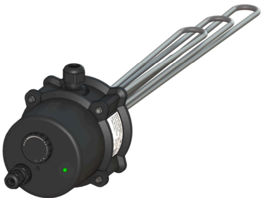
EGO Smart Heater